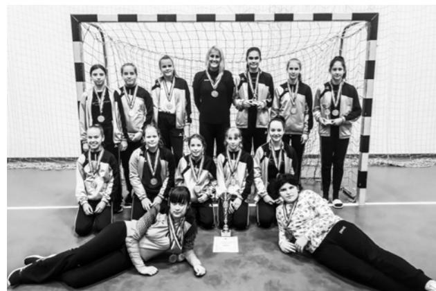
Aranyérmes lányok az Őszi Kupán