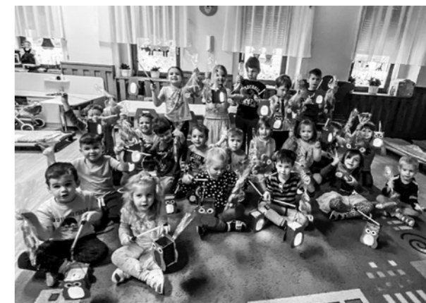
Márton-nap az óvodában