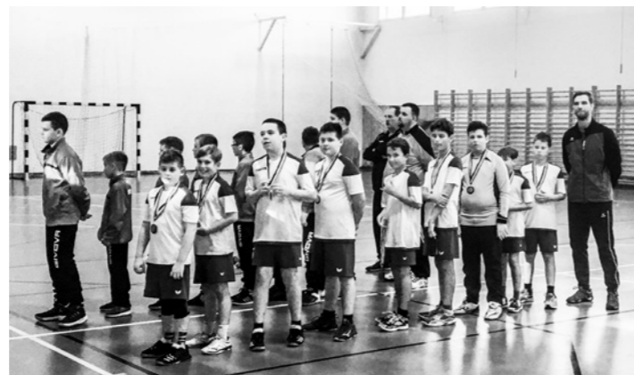
Az Őszi Kupa bronzérmes fiúcsapata